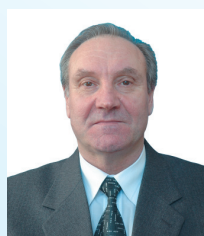
Новиков Александр Иванович