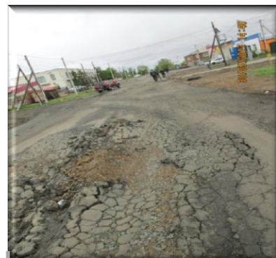
Автомобильная дорога по ул. Кирова в с. Одесское после ремонта

Отдельными муниципальными образованиями не обеспечивалось соблюдение Правил приемки работ при строительстве и ремонте автомобильных дорог,