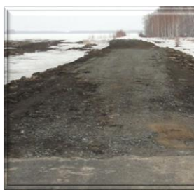
Автомобильная дорога Оконешниково-Черлак, участок км.30 Маяк в Оконешниковском районе до реконструкции

В ходе проверок Палатой отмечено, что резервом пополнения дорожного фонда Омской области может стать, в том числе, принятие действенных мер по взысканию