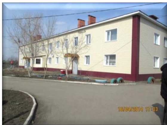
Одесское сельское поселение, многоквартирный жилой дом после капитального ремонта

Выборочной проверкой установлены факты завышения объемов и стоимости выполненных работ на общую сумму 364,5 тыс. рублей (Павлоградский район – 336,8 тыс. рублей, Одесское сельское поселение – 27,7 тыс. рублей), которые свидетельствуют о ненадлежащем исполнении функций контроля уполномоченной организацией по осуществлению технического надзора за