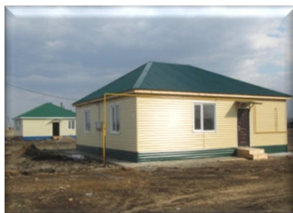
с. Лукьяновка, построенные жилые дома в целях переселения граждан

Муниципальными заказчиками и казенным учреждением Омской области «Омскоблстройзаказчик» не осуществлен контроль качества принятых от застройщиков жилых помещений. Например, в Тевризском районе и Павлоградском городском поселении приобретенные квартиры не были обеспечены вентиляцией. Во всех муниципальных образованиях не в полном объеме выполнены работы по внутренней отделке помещений, электроснабжению и благоустройству придомовых территорий многоквартирных домов.