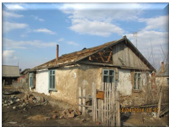
с. Лукьяновка, аварийный дом

Администрацией Лукьяновского сельского поселения Одесского района в нарушение требований законодательства в сфере размещения заказов внесены изменения в муниципальные контракты по срокам передачи поставщиками квартир, что привело к нарушению установленных сроков переселения граждан из аварийных домов.