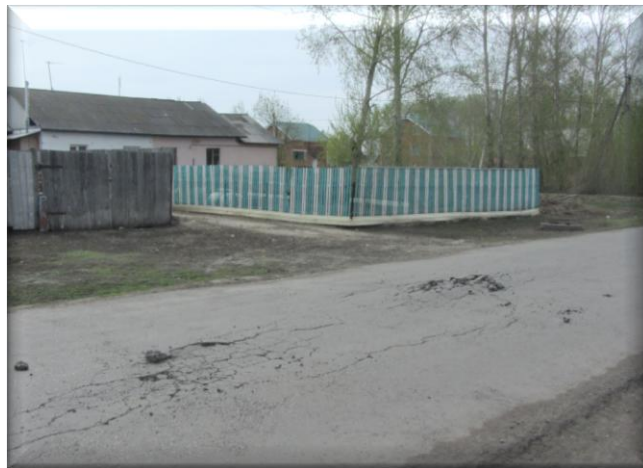
Отремонтированный участок дороги по ул. Труда в Пушкинском сельском поселении

Кроме того, в Пушкинском сельском поселении Омского муниципального района и Шербакульском городском поселении при наличии дефектов асфальтобетонного покрытия на объектах ремонта государственными заказчиками не проводилась претензионная работа с целью их устранения подрядными организациями в рамках гарантийных обязательств. По результатам проверки приняты соответствующие меры – дефекты устранены.