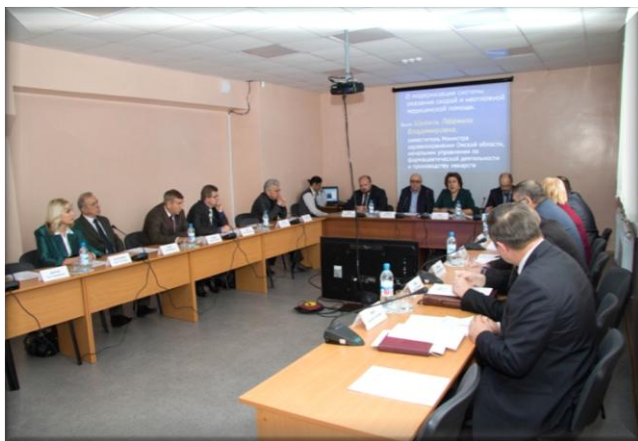
Выездное заседание комитета Законодательного Собрания Омской области

Аудитором, осуществляющим контроль в сфере здравоохранения, принято участие в выездном заседании комитета Законодательного Собрания Омской области по социальной политике по вопросу модернизации системы оказания скорой и неотложной медицинской помощи, в ходе которого рассматривались вопросы оснащения бюджетного учреждения здравоохранения