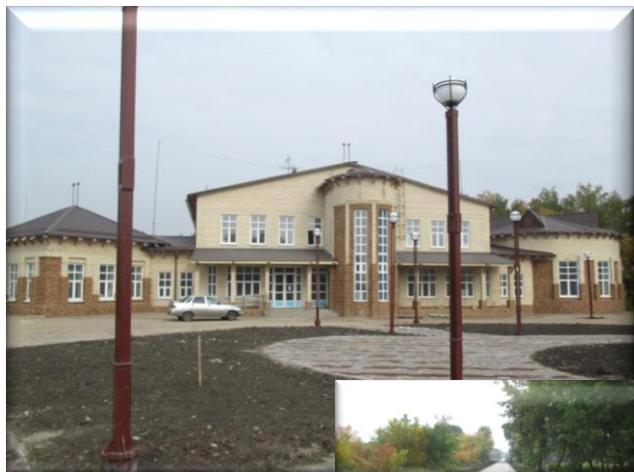
Природный парк «Птичья гавань»

Бюджетным учреждением «Природный парк «Птичья гавань» в целях сохранения парка и организации мероприятий, связанных с отдыхом населения, произведена обработка территории от клещей и малярийного комара, очистка водоема от растительности, закачка воды из реки Иртыш для поддержания уровня воды, вывоз мусора и др.