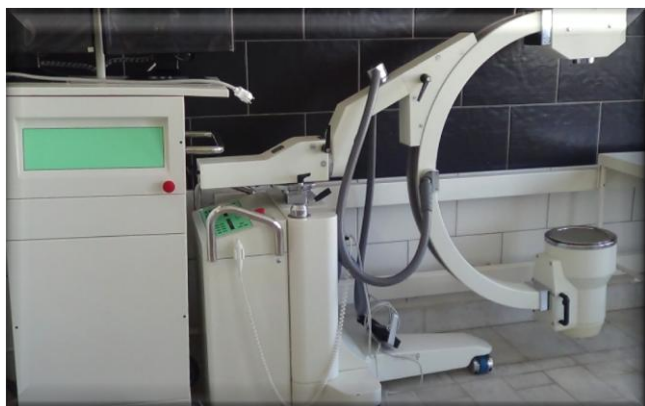
Рентгеновский аппарат типа С-дуга

Межрайонные центры по оказанию травматологической помощи на базе центральных районных больниц (далее – ЦРБ) Исилькульского, Калачинского, Тарского, Таврического и Тюкалинского муниципальных районов Омской области оснащены эндоскопическим оборудованием, рентгеновскими аппаратами типа С-дуга, операционными столами с ортопедическими приставками. Рентгеновский аппарат типа С-дуга также поступил в областную клиническую больницу.