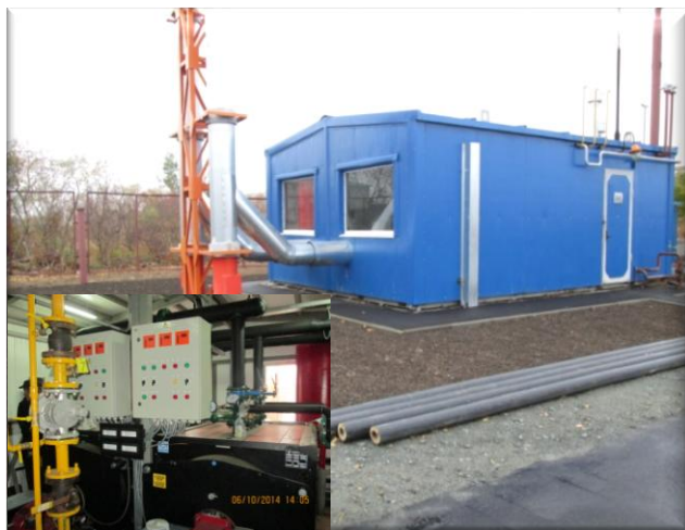
Газовая блочно-модульная котельная с. Юрьевка Павлоградского района

Выполнены проектно-изыскательские работы по строительству внеплощадочных сетей в районе ул. Завертяева для комплексной застройки территории в городе Омске. Законченные строительством объекты: газовая блочно-модульная котельная в с. Юрьевка Павлоградского района; распределительный газопровод природного газа к микрорайону комплексной застройки «Заречный» в городе Калачинске; водопроводные сети в микрорайоне Дачный в с. Одесское приняты в эксплуатацию.